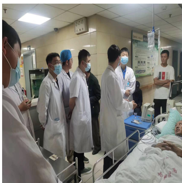
带教老师指导住培学员进行教学查房