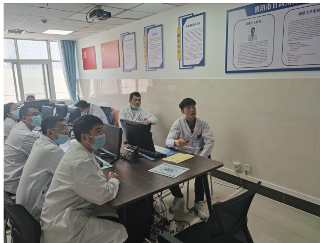
住培学员参加入基地培训