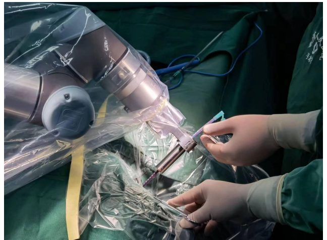
带教老师指导员进行神经外科手术操作床旁教学