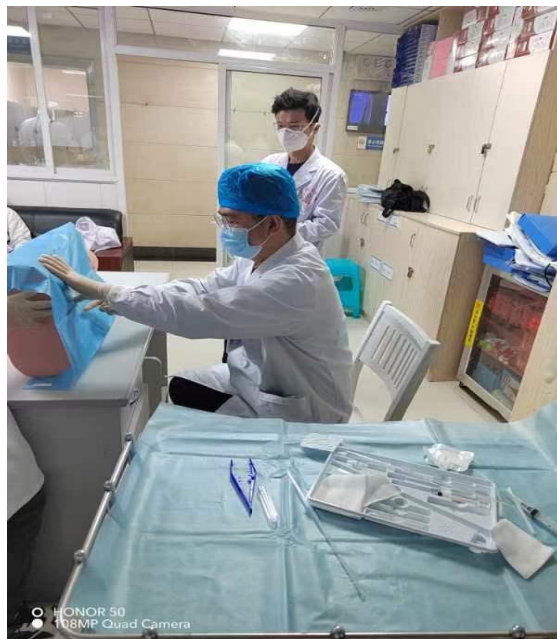
神经外科基地出科技能考核