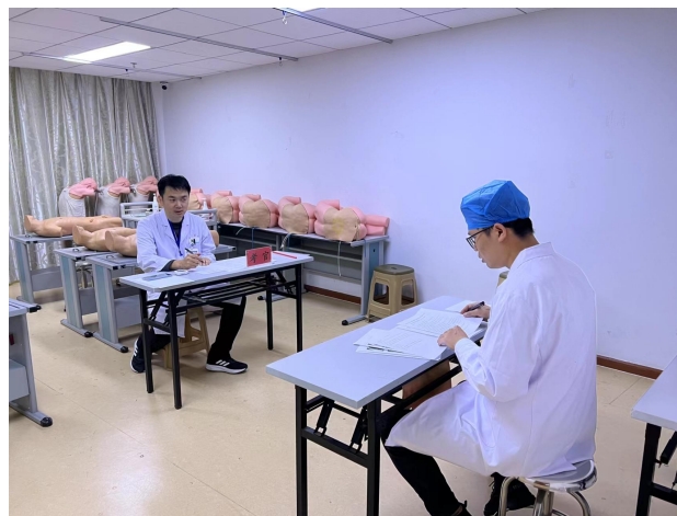
参加临床技能考核